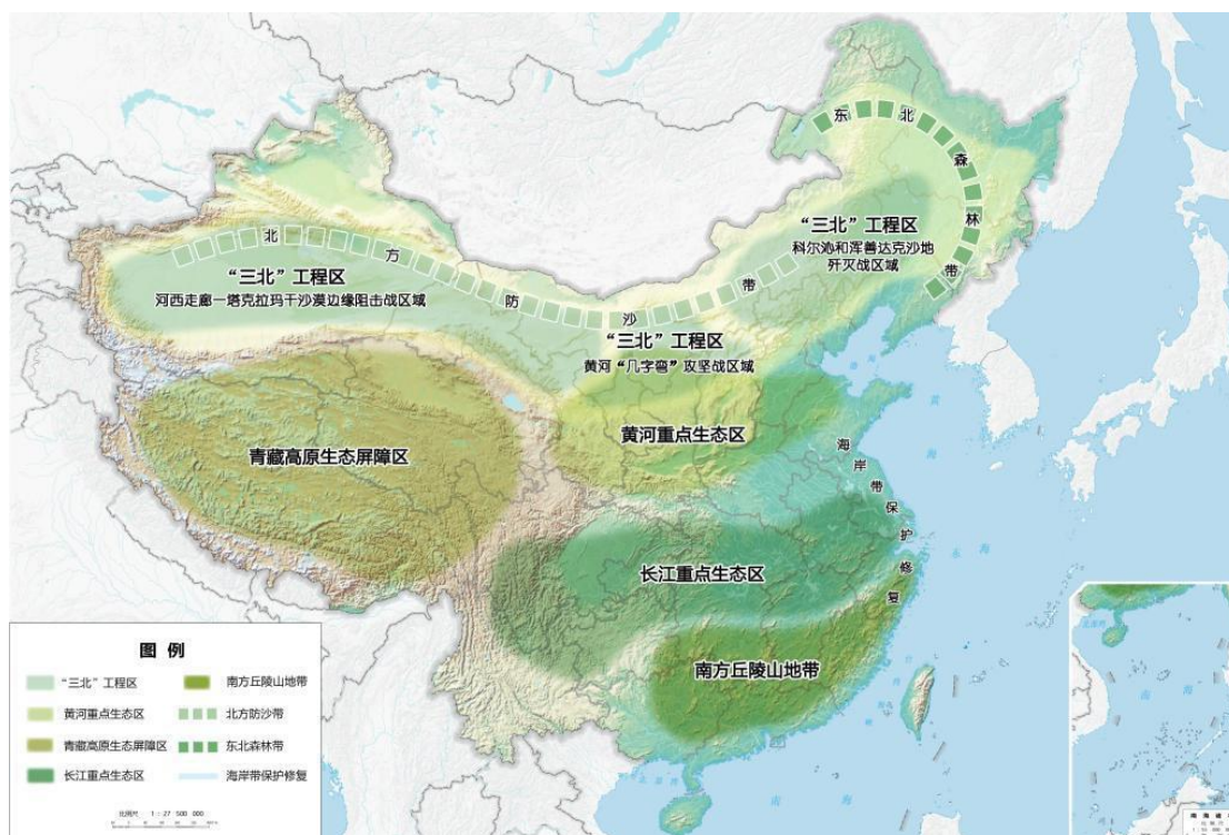
图3 重要生态系统保护和修复重大工程布局图