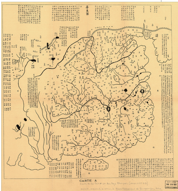
《华夷图》反映出传统中国“华夷分离”的天下观

理想终究不是现实。我们得承认,目前56个民族构成的中国人类生态体系远非完美。以边疆少数民族之情况来看,层出不穷的西藏、新疆问题,以及因东南沿海经济发展而造成南方边地农村经济空洞化的问题,即为明证。