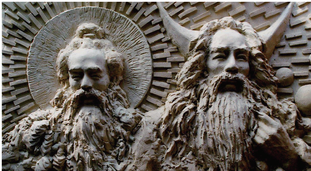
炎帝与黄帝被视为中华民族的祖先

费孝通先生的“中华民族多元一体格局”,注意到中原汉族之外中国边疆多民族的存在,及其与汉族往来互动中的彼此交融,但他强调的仍是汉族在中华民族形成中扮演的核心与凝聚者角色。较为新颖的是,他指出“中华民族作为一个自觉的民族实