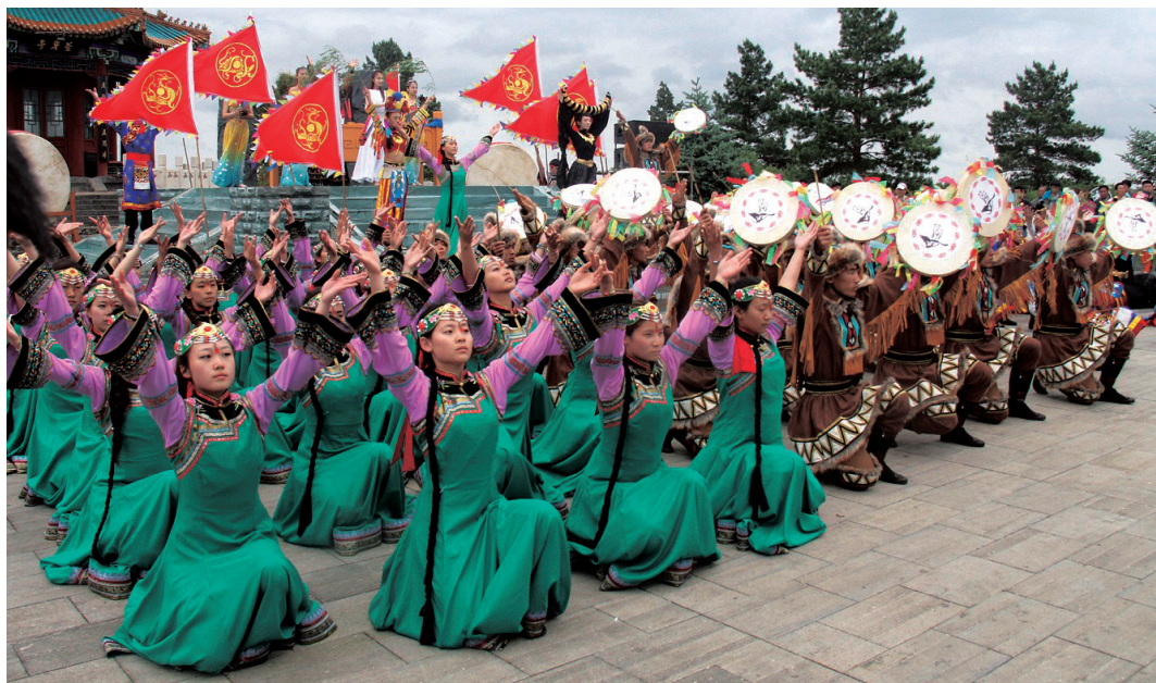
歌舞表演是民族身份建构的重要途径

事实上,当年的边疆考察者不只是讶于边民对民族国家的无知,也讶于居于民族国家核心的一般知识分子对边疆之地与人的无知。1930年代,感于国人地理知识中甘肃西南部、青海南部、西康北部“还是一片白地”,让青年探险家与民俗考察者庄学本,“为了这样大的使命”,进入边区进行考察。同样在1930年代,感慨于“我侪今