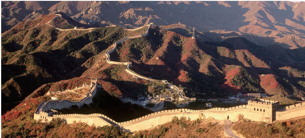
长城在中国历史上被赋予了多个层面的意涵

只有尊重及呈现所有这些突破与穿越之历史，才能理解古今长城意涵的变化，才能体认许多北方民族成为今日中国人的人类生态意义。简单地说，今日中国需要的是长城在众人努力下逐渐解体而成为观光景点的历史。