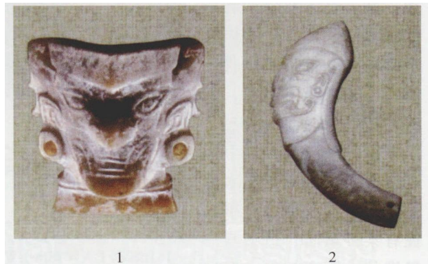
图三 石家河文化玉神人像 1. W6 : 32 2. W6 : 17

四川广汉三星堆出土青铜人像 三星堆遗址2座大型祭祀坑中出土了大量青铜神人像及青铜神树等遗物。其中，青铜站立人像，高达2.62米，头戴冠，身着长袍，站在一个台子上。其他50余件巨型青铜人头像，有的两目突出，造型奇特；有的还带有金面具，极为神秘 [15] 。与三星堆青铜人像密切相关的还有出土于成都金沙遗址的青铜立人