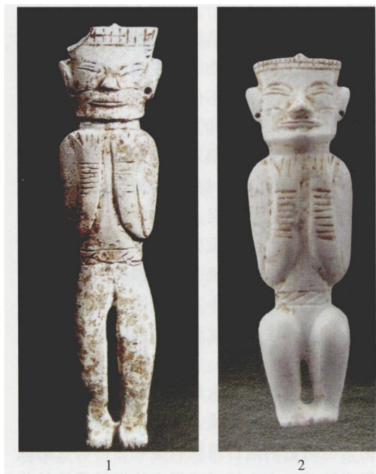
图一 安徽含山凌家滩出土玉人像 1. 87M1：1 2. 98M29：14

良渚文化的神人形象 良渚文化最重要的文化现象之一是在大型墓葬中随葬玉琮、玉钺和玉璧。这些特殊玉器上往往饰有独特的兽面纹，其中尤以玉琮为突出。琮造型独特，其突出之处即是它的纹饰。据观察，“对兽面纹的表现，应是琮最基本的成型意图”。这类纹饰基本上由双眼、鼻、嘴（分有獠牙和无獠牙两种）组成，造型抽象。1986年，余杭反山M12出土的琮、钺上出现了完整而详细的图案形象（图二），揭开了良渚玉器上纹饰结构之谜。据发掘者研究，“其上端为一略呈弓形的冠，冠下缘的正中有一倒梯形的脸框，脸框内有圆圈的眼，眼的两侧各刻以短线表示眼角，鼻作悬蒜状，两侧刻有鼻翼，口部作扁圆形，内刻平齐的牙齿，显然是一个人的面部。脸框外缘为饰