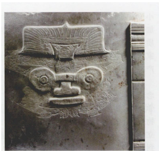
图二 良渚文化玉琮上的神人形象（反山M12：98）

辽宁凌源、建平牛河梁出土泥塑人像 在红山文化的牛河梁遗址内主梁北山丘“女神庙”内出土了一批泥塑人物群像，已发现的人像残块有头部、肩臂、乳房、手等，分属6个个体，一般与真人大小相近，有的是真人的3倍。特别是1尊与真人大小相